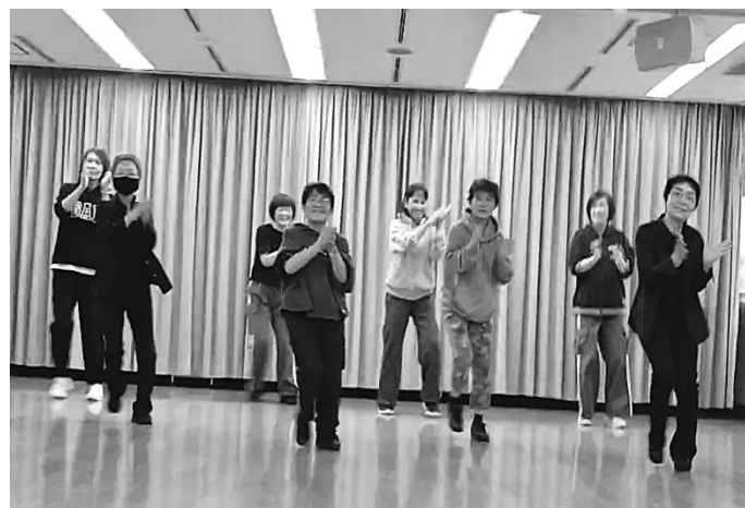
ウエルネスダンス