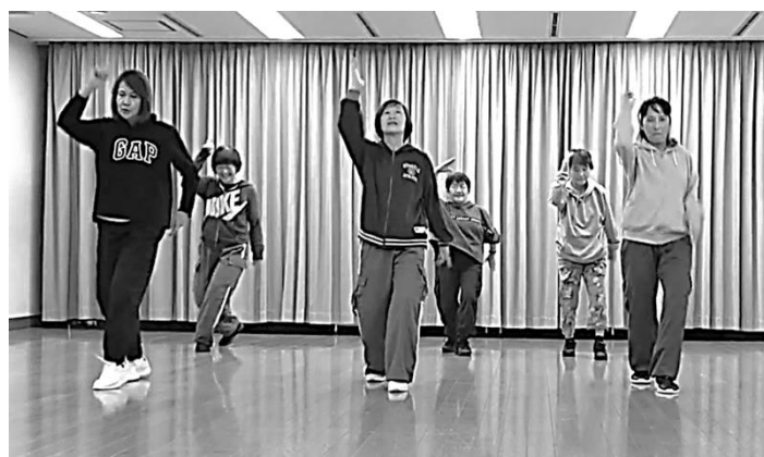
ヒップホップダンス