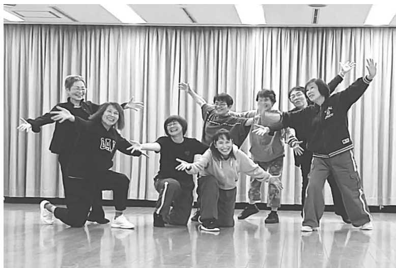
ウエルネスダンス